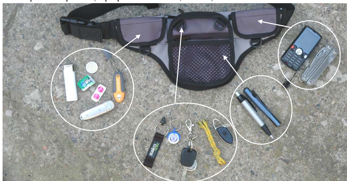
příklady využití vnějších kapes a doplňků pro otevírání (tasení) ledvinky