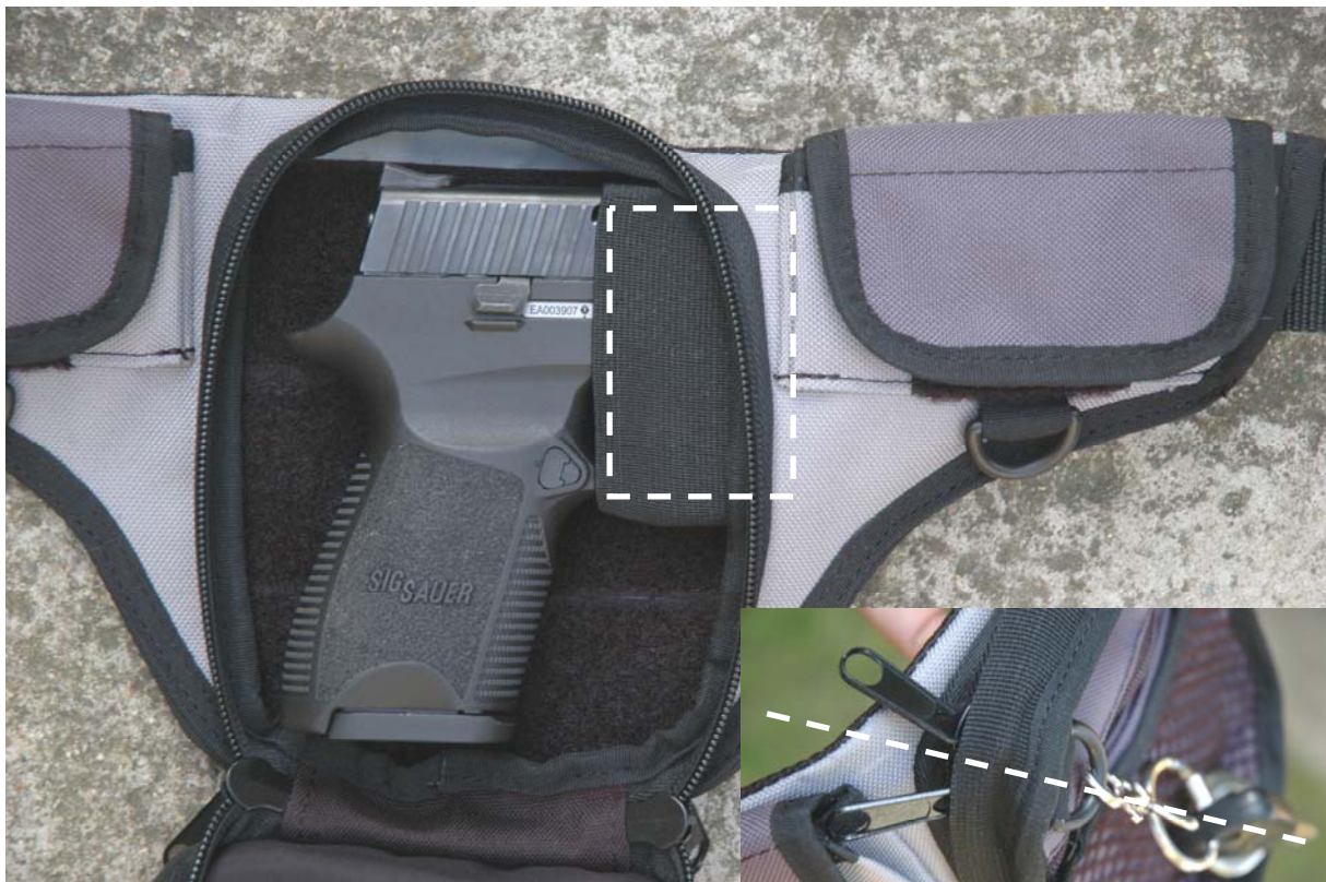
Detail správného uzavření zipu (nastavení jezdců) přesně proti otevíracímu poutku .