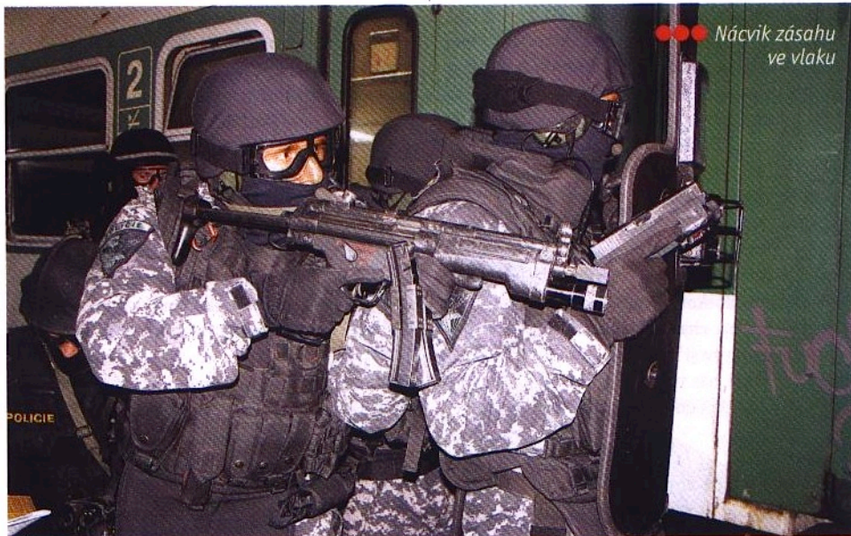
●●● Návčik zásahu ve vlaku

V současné době působíme na misi v Iráku a v Pákistánu. Afghánistán jsme přenechali našim kolegům z 601. Skupiny speciálních sil, protože ČR má v této lokalitě silný vojenský kontingent a bylo to pro nás výhodnější z kapacitních důvodů. Díky