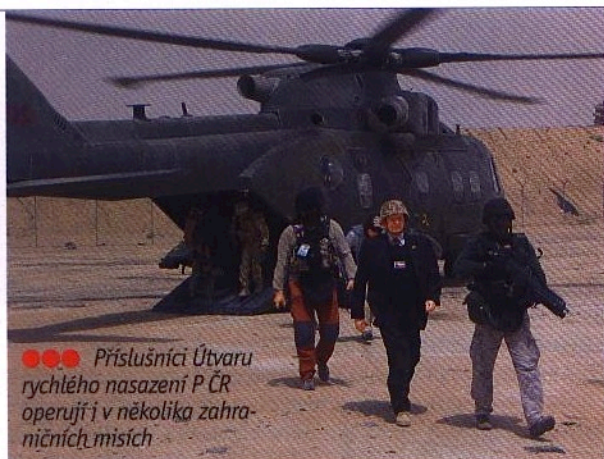
●●● Příslušníci Útvaru rychlého nasazení P ČR operují v několika zahraničních misích