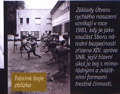
Trénink boje zblízka

Základy Útvaru rychlého nasazení vznikají v roce 1981, kdy je jako součást Sboru národní bezpečnosti zřízena XIV. správa SNB, jejíž hlavní úkol je boj s mimořádnými a zvláštními formami trestné činnosti.