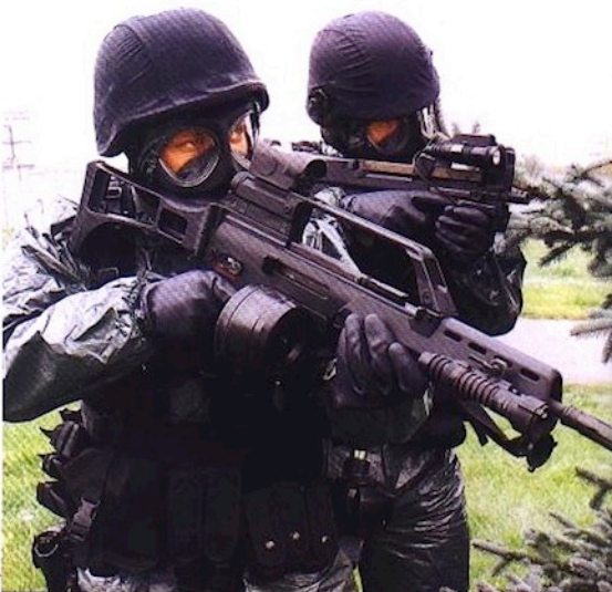
●●● Příslušníci ÚRNA disponují i zbraněmi FN P90 a HK G36

2000 – Všetaty – zadržení ozbrojených pachatelů loupežného přepadení pošty, tento zákrok byl za-